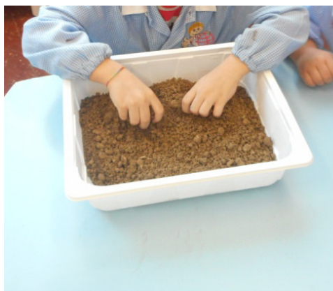
GIOCHI CON IL TERRICCIO